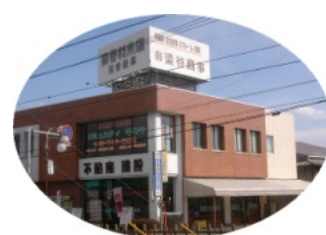
2011年5月5日発行第32号 発行：染谷商事広報部 発行責任者：染谷貴子

(社)春日部法人会庄和支部 ◆記念講演会のお知らせ 法人会の基本的指針 「法人会はよき経営者をめざすもの。自己啓発を支援し、納税意識の向上と企業経営および社会の健全な発展に貢献します」