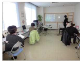
染谷商事地域パソコン教室 クラウド講座開催